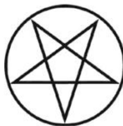
Figura 1.3: Pentáculo invertido.