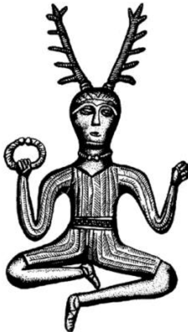
Figura 1.1: Cernunnos: o deus cornífero.

Muitos autores assinalaram a semelhança entre a figura de Cernunnos e a representação da imagem cristã de Satanás. É provável que a dupla participação do deus cornífero no mundo da luz e no das sombras tenha influenciado as primeiras representações do Anjo Caído.