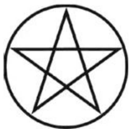
Figura 1.2: Pentáculo.

Em algumas irmandades atuais de magia Wicca, o pentagrama é utilizado também para identificar os membros que alcançaram o segundo nível de sabedoria esotérica.